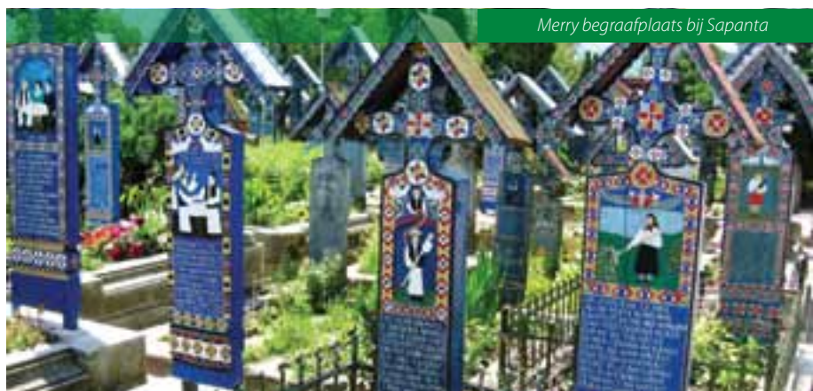
Merry begraafplaats bij Sapanta