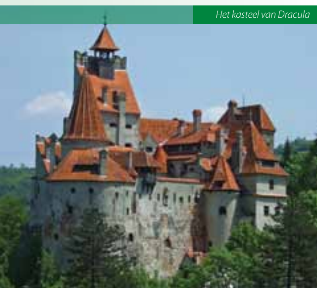
Het kasteel van Dracula